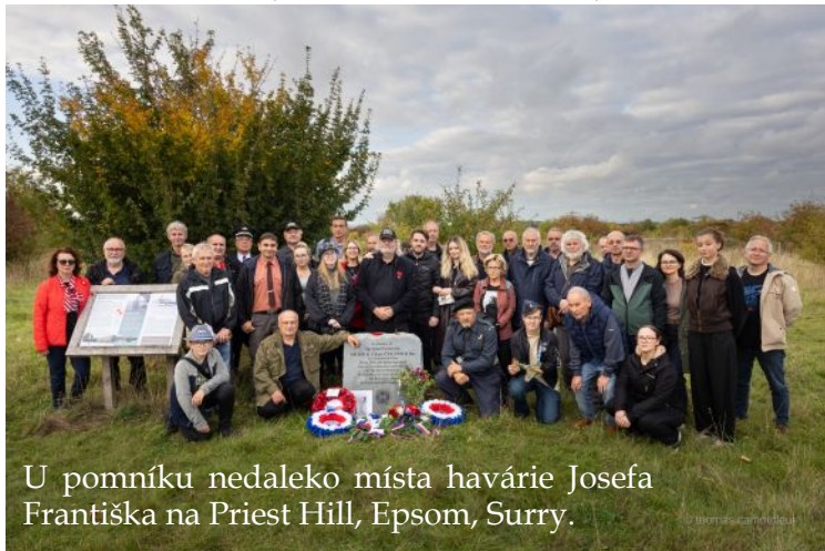
U pomníku nedaleko místa havárie Josefa Františka na Priest Hill, Epsom, Surry.