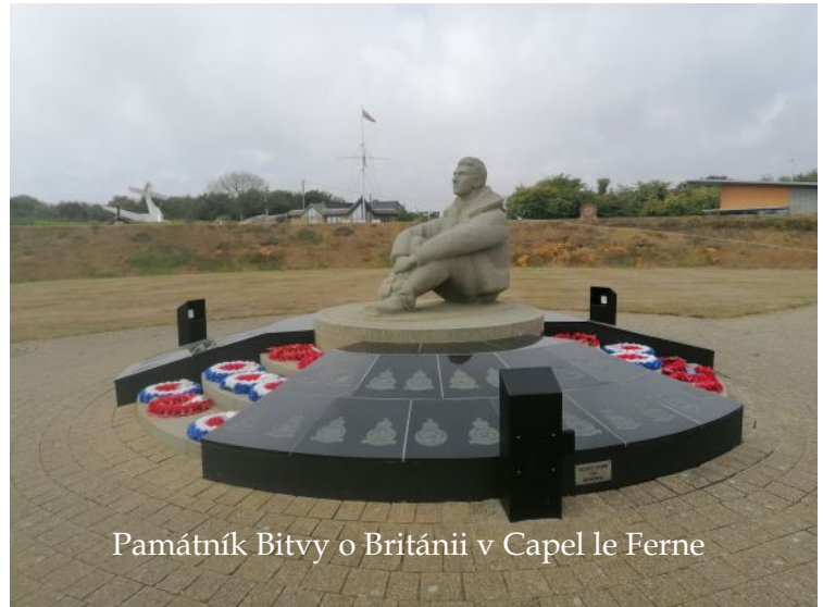
Památník Bitvy o Británii v Capel le Ferne

Poděkování patří obci Otaslavice, která významně přispěla na naši cestu. Těšíme se na další společné zážitky!